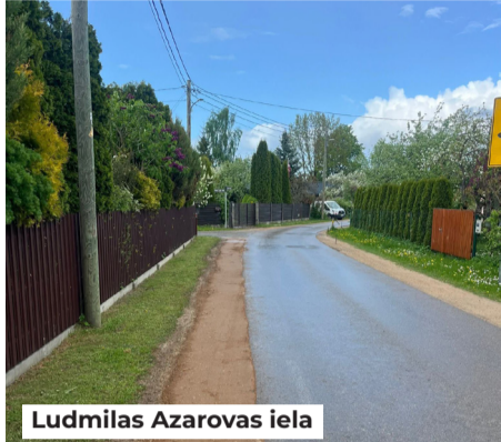
Ludmilas Azarovas iela