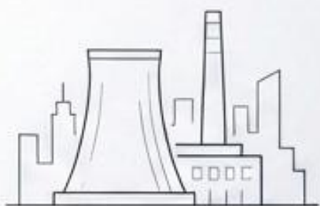
Ādažu centra Stacija